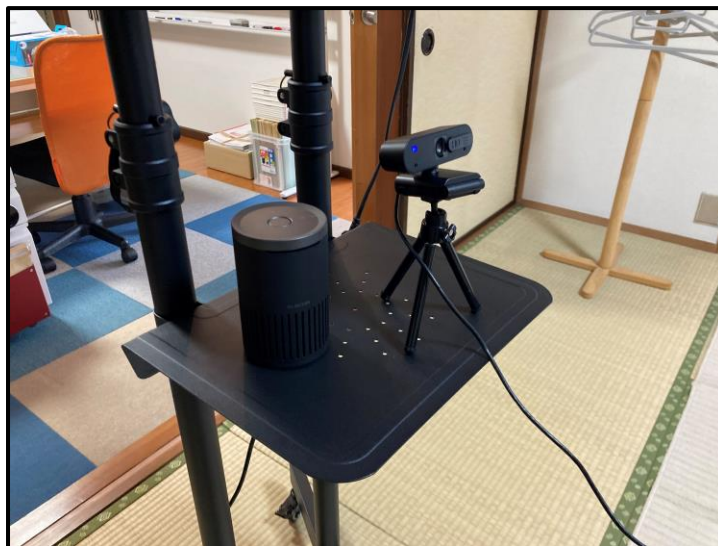
Web カメラ スピーカーフォン