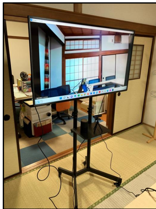
業務用液晶ディスプレイ